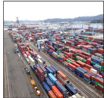
新興津コンテナターミナル