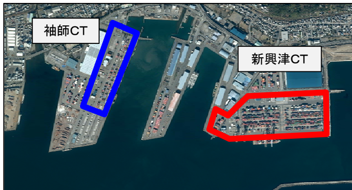
清水港のコンテナターミナルの位置