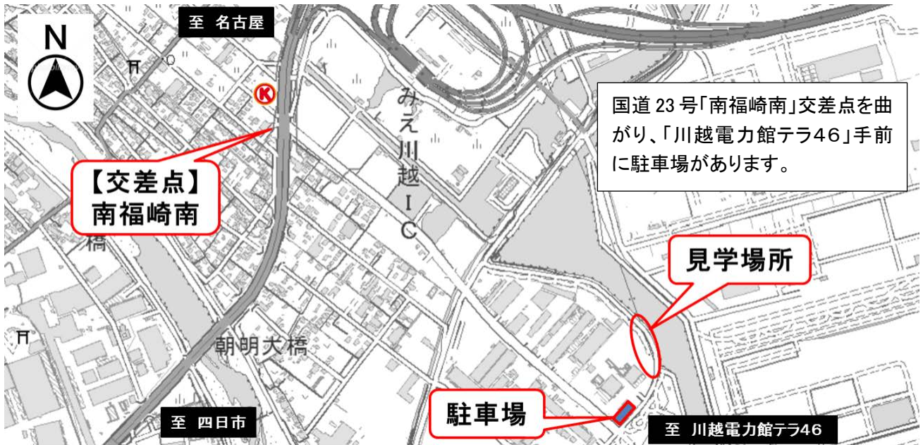
この地図は、国土地理院の電子地形図(タイル)を使用したものである。