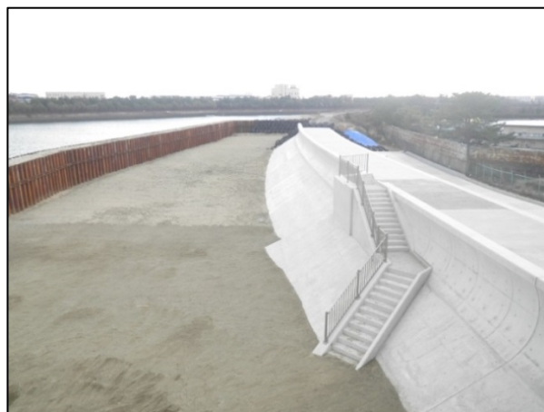
海岸堤防の状況(完成済み区間)