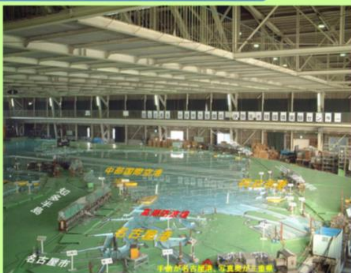
巨大な伊勢湾模型