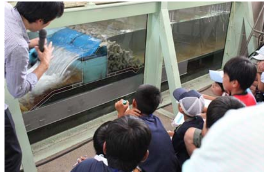
【施設見学イメージ：津波実験】