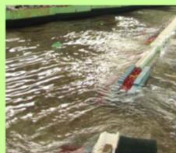
平面水槽 防波堤安定実験