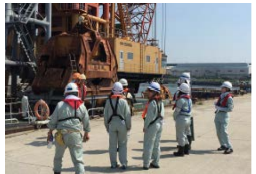
昨年度の「なでしこパトロール」