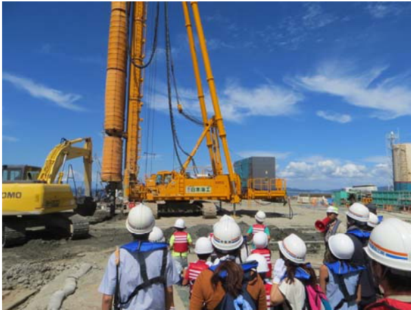
地盤改良工を確認している様子