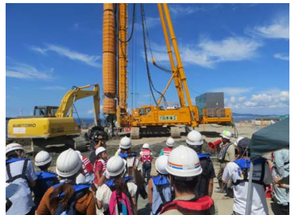
パトロールの実施状況

パトロール後の意見交換会では、参加した親子から「声を掛けあって力を合わせて工事していてすごい」「通路と作業区域が分けられていて歩きやすかった」「熱中症対策がきちんと取られている」「発電機の近くに消火器を置く等安全対策が取られている」等、活発な意見がありました。