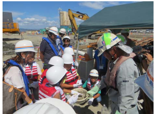
セメントが固まる場所を確認している様子