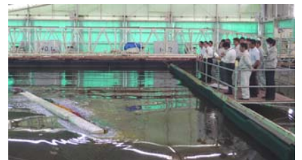
【施設見学イメージ】

13:00 座学(伊勢湾の環境や港湾における防災など) 13:30 実験センター(伊勢湾環境水槽観察、津波実験、液状化実験等) 14:15 終了