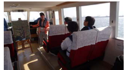
【港内見学イメージ】

09:15 座学(名古屋港の概要、高潮防波堤改良事業の概要) 10:15 港内見学(名古屋港内の見学、高潮防波堤改良事業の見学(船上)) 11:30 終了