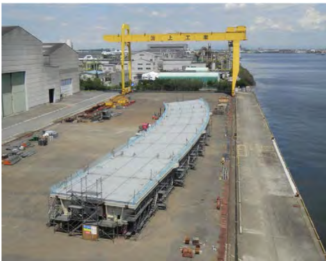
鋼製橋桁（長さ 86.6m・幅 11.3m・重さ 542t）