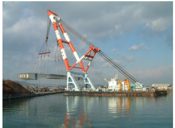
今回使用する大型起重機船「金剛」（2050 t 吊）