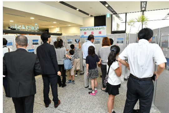
記念イベント「船から見た「なごや港」フォトコンテスト」 作品展