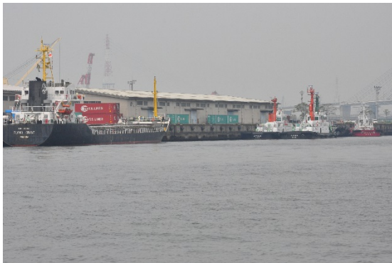
【現地視察】 整備予定地