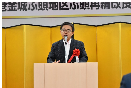
【来賓挨拶】 大村名古屋港管理組合管理者 (愛知県知事)