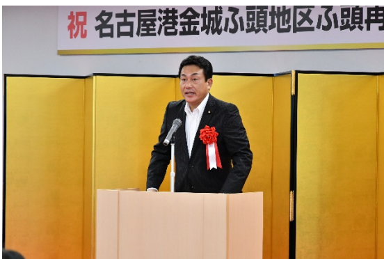
【来賓挨拶】 藤川参議院議員