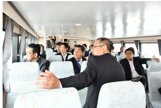
【現地視察】 船内の様子