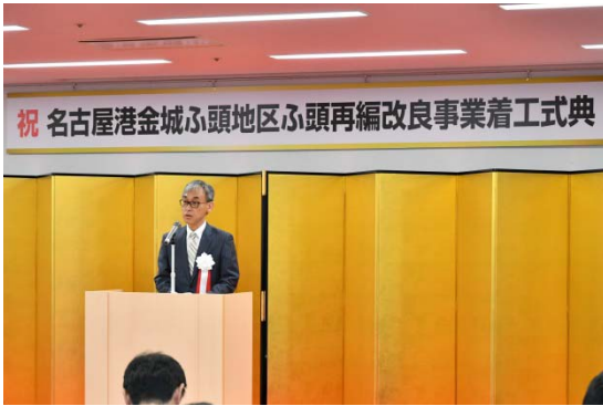
【式辞】 塚原中部地方整備局長