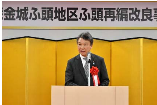
【来賓挨拶】 大野国土交通大臣政務官