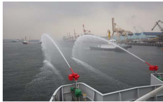
流出油防除訓練の様子(白龍からの放水による流出油拡散作業)