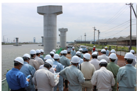
富双水路上の橋脚群