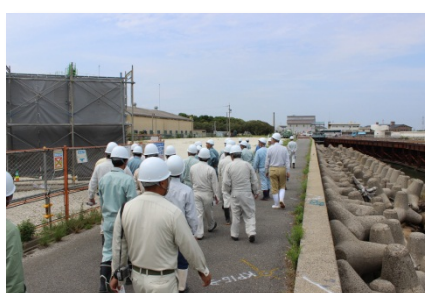
海上施工箇所の見学