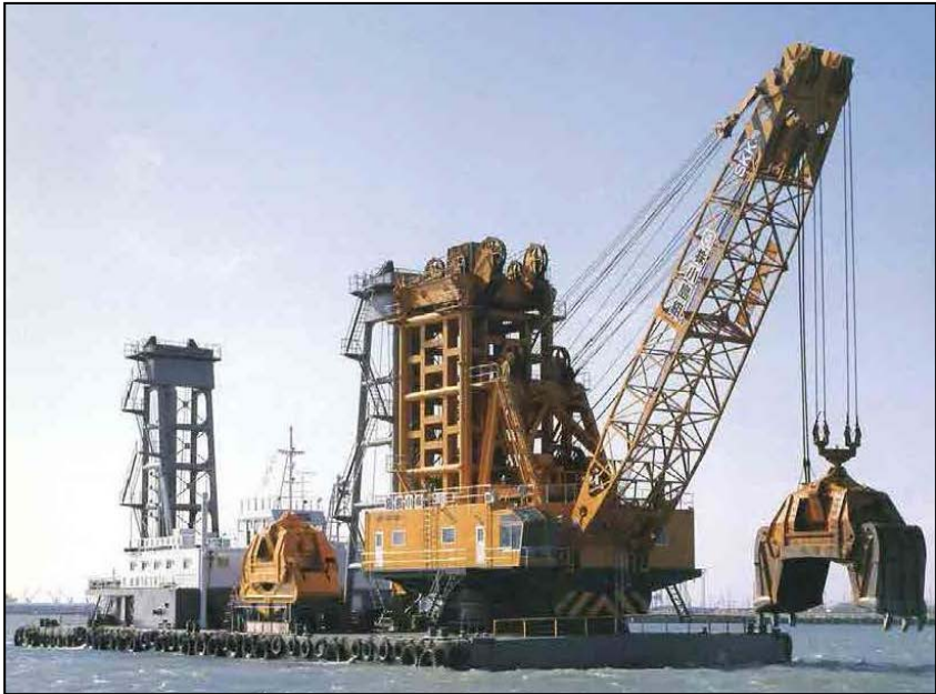
1日10トンドンプトラック 約600台分の土砂を掘ります