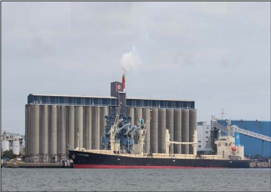
大型化する船舶のために浚渫工事を行います