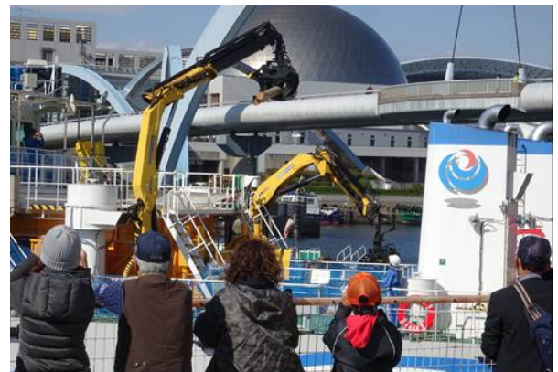
流木回収作業のデモンストレーションの見学