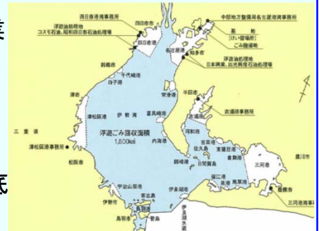
担務海域 伊勢湾・三河湾 (1,800km 2 )