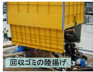
回収ゴミの陸揚げ