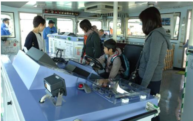
船内見学(運転席に座る子供)

また、船内には 回収された流木等が展示されており、見学者は海を漂流していた流木の大きさに驚くとともに、「白龍」の役割について理解を深めて頂きました。