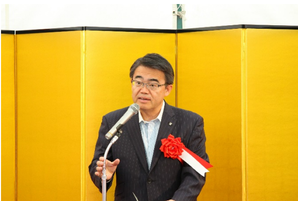
【来賓挨拶】大村名古屋港管理組合管理者 (愛知県知事)