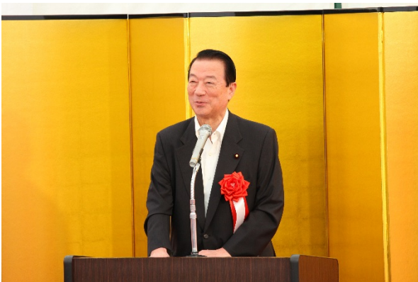
【来賓挨拶】江崎衆議院議員