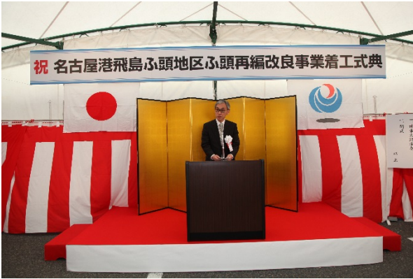
【式辞】塚原中部地方整備局長