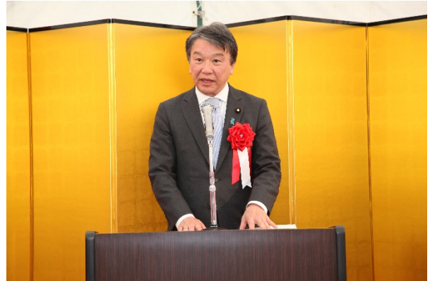
【来賓挨拶】大野国土交通大臣政務官