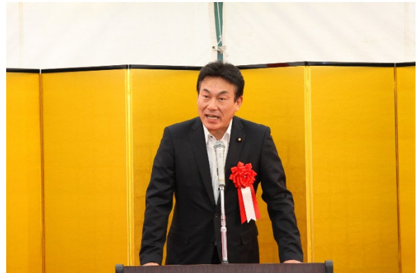
【来賓挨拶】藤川参議院議員