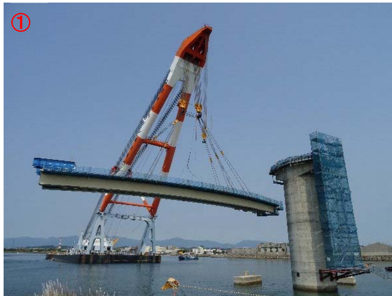
橋桁を吊り上げ、橋脚前まで移動(9:30 頃)