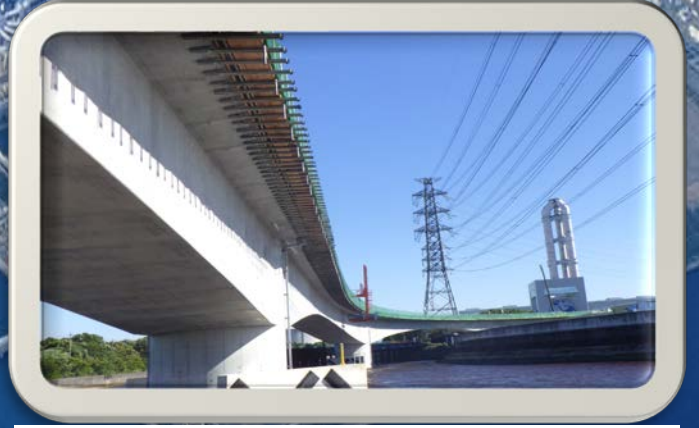
⑥新田水路から見た風景

臨港道路（霞4号幹線）が見えるおすすめのビューポイントをご紹介します 直接見てみると、良い『愛称』が思い浮かぶかも！ ※うみてらす14からご覧になるためには、入場料（一般（高校生以上）300円）が必要です。 ※交通法令等を遵守の上、ご覧ください。