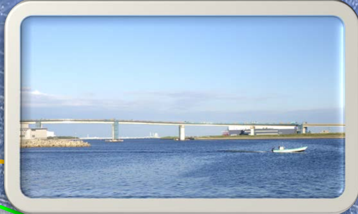
②富双緑地から見た風景