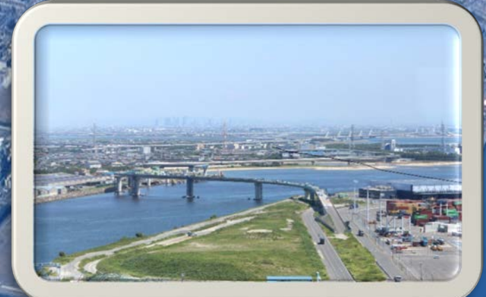
①ポートビル（うみてらす14）から見た風景