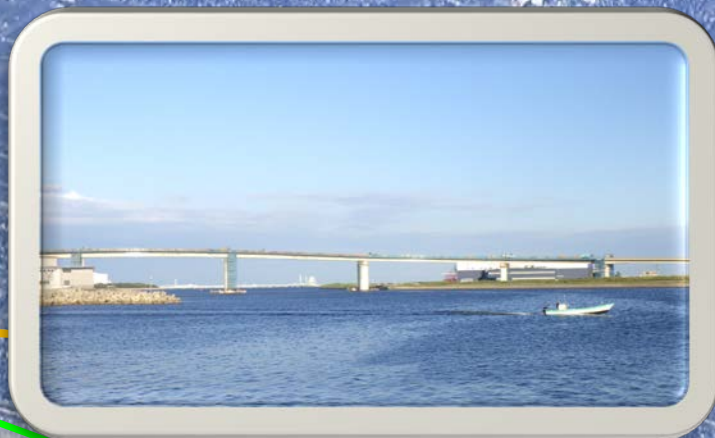
②富双緑地から見た風景