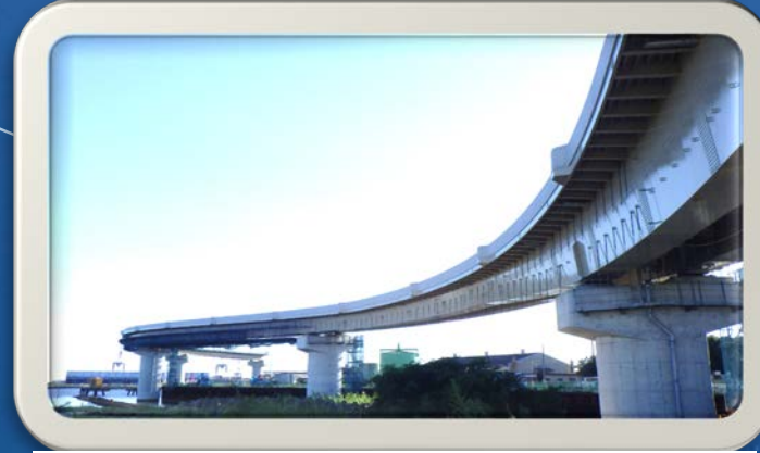
③高松海岸から見た風景