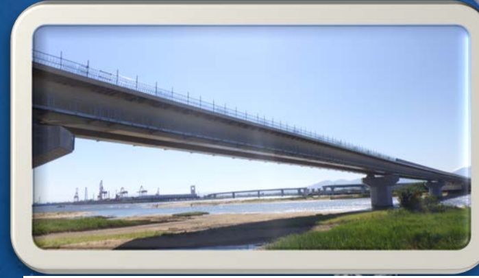
④朝明川（左岸）から見た風景