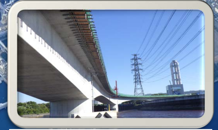
⑥新田水路から見た風景

臨港道路（霞4号幹線）が見えるおすすめのビューポイント をご紹介します 直接見てみると、良い『愛称』が思い浮かぶかも！