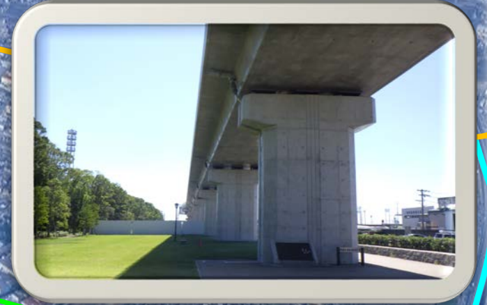
⑤川越緑地から見た風景