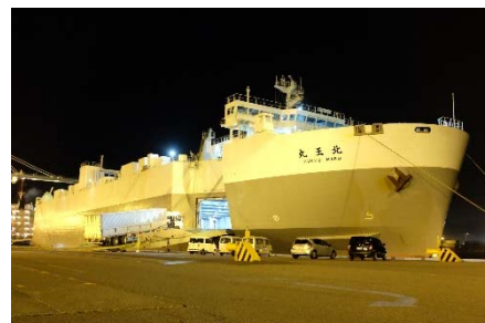
RORO船輸送の状況

内貿RORO船は、今後様々な用途での利活用が期待されています。今回内貿RORO船の利活用状況についてご覧頂くため、大分⇄清水航路について取材会を開催いたします。