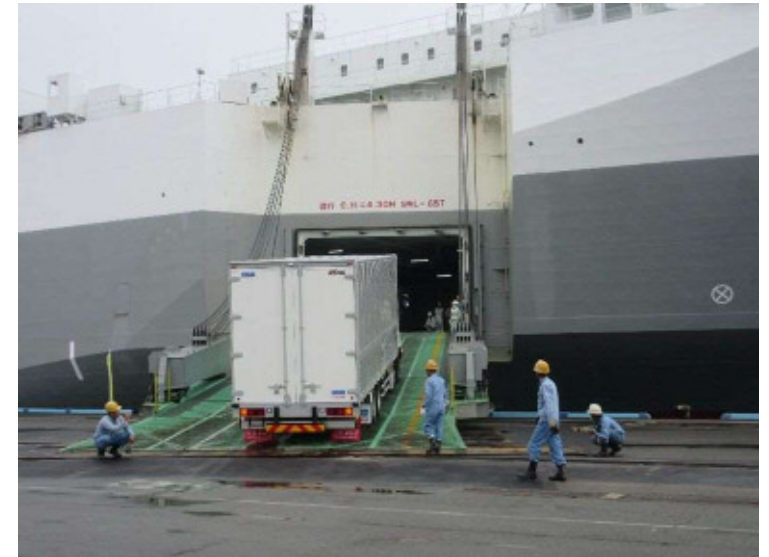
RORO船輸送の状況

貨物を積んだトラックやトレーラーをそのまま運べる船。船の前と後ろに出入り口があり、トラックが自分で乗り(ロールオン)・降り(ロールオフ)できている。