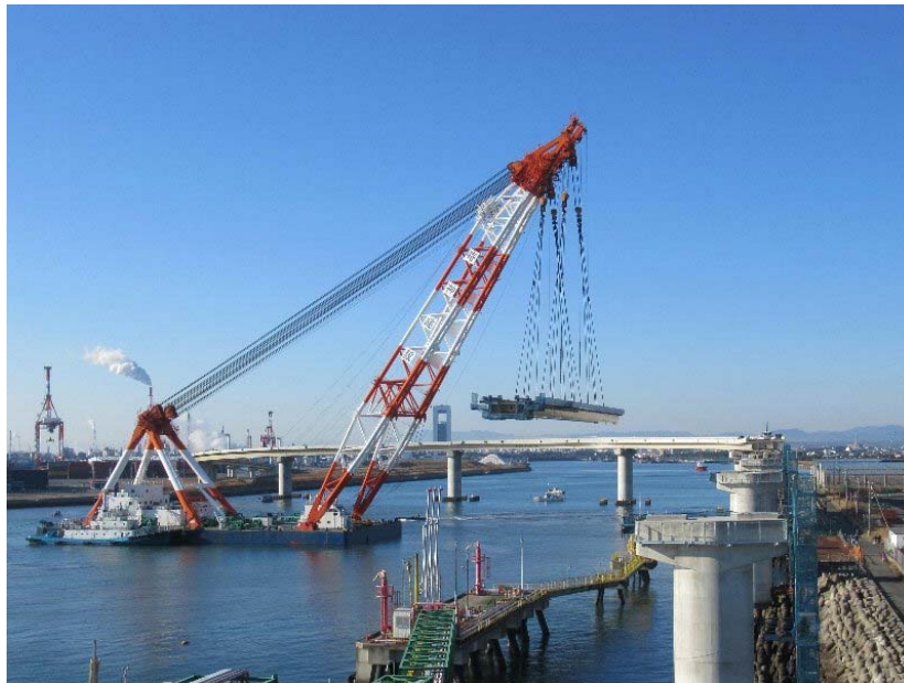
橋桁を吊り上げ、橋脚前まで移動(9:00 頃)