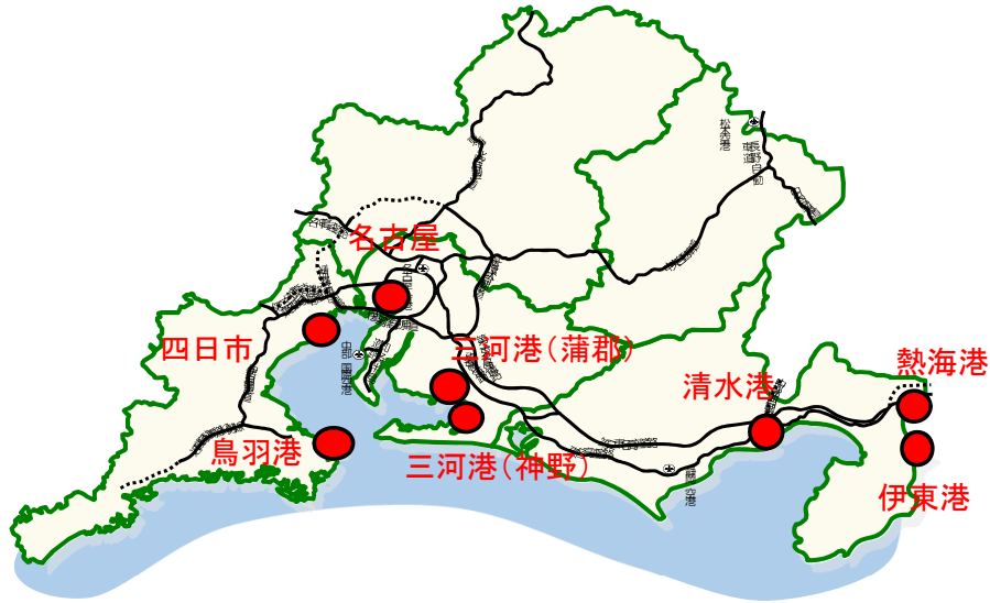
中部地整管内にクルーズ船が寄港あった港の位置図