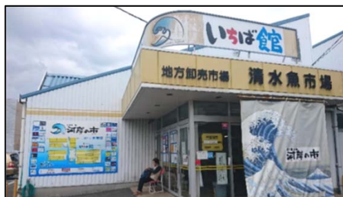
清水魚市場「河岸の市」