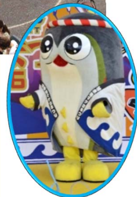
マスコット「まぐまぐ」