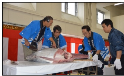
マグロ解体ショー(清水港マグロまつり)