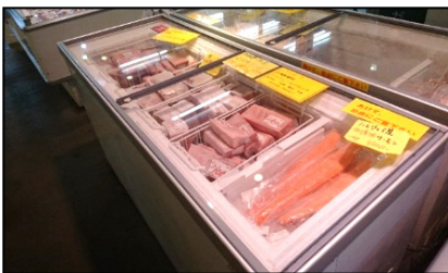
清水魚市場「河岸の市」でのマグロ販売

なお、6月17日（日）に代表施設『清水魚市場「 かし の いち 市」』（静岡県静岡市）において、「みなとオアシスマぐろのまち清水」の登録証交付式を行います。