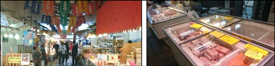
冷凍マグロの水揚げ日本一を誇る清水港！自慢の味を是非ご賞味ください。