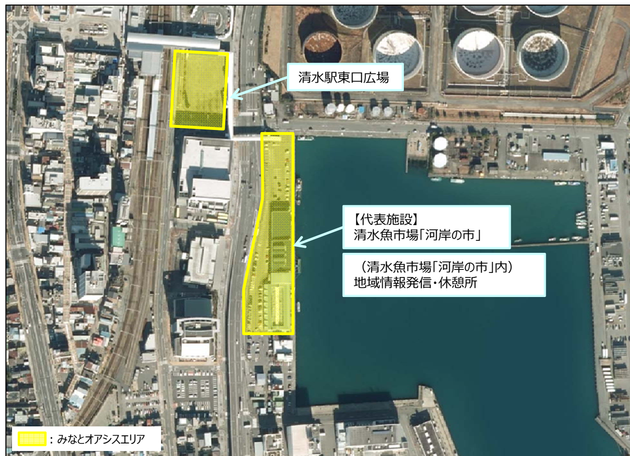
黄色い箇所：みなとオアシスエリア