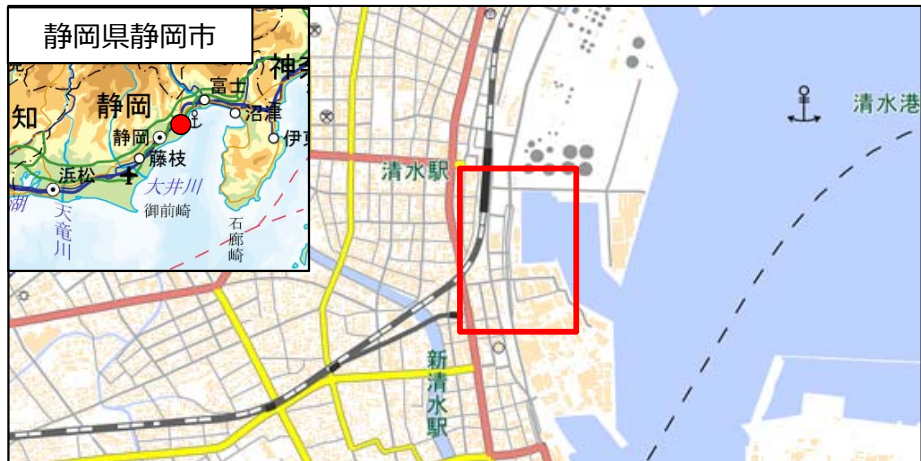
国土地理院地図（電子国土Web）( http://maps.gsi.go.jp )をもとに国土交通省作成