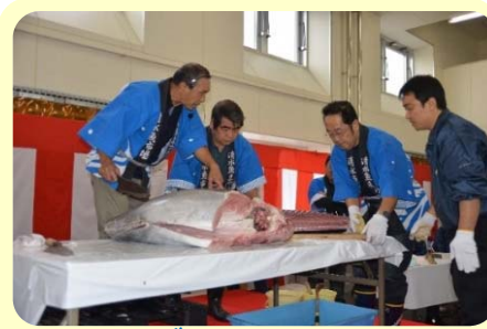
マグロ解体ショー