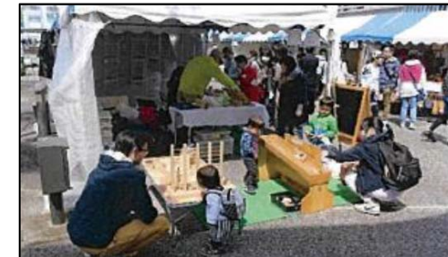
アートクラフトフェア