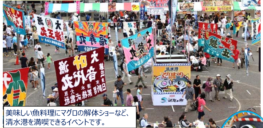
美味しい魚料理にマグロの解体ショーなど、清水港を満喫できるイベントです。