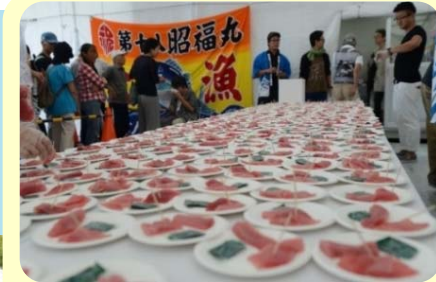
マグロのふるまい