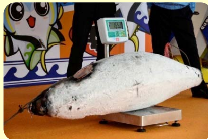
マグロ体重当てクイズ