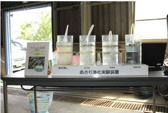
アサリの浄化実験