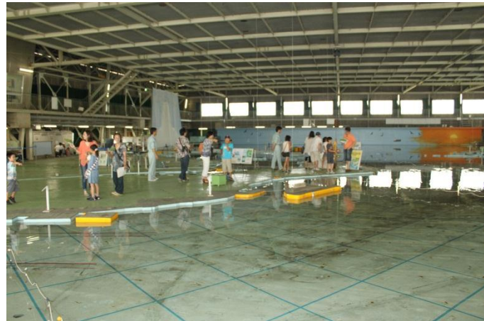
伊勢湾の潮流実験