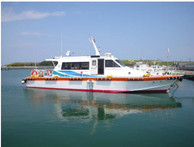
見学で乗船する港湾業務艇「ふじ」

この御前崎港について、普段は見るのが難しいコンテナターミナルなどの港の施設、整備中の防波堤などの工事現場や作業船を船上から見学することを通じて、保護者の方には港について色々ご理解いただき、園児にも港の見学の体験で港に対する興味が深まることを期待しています。