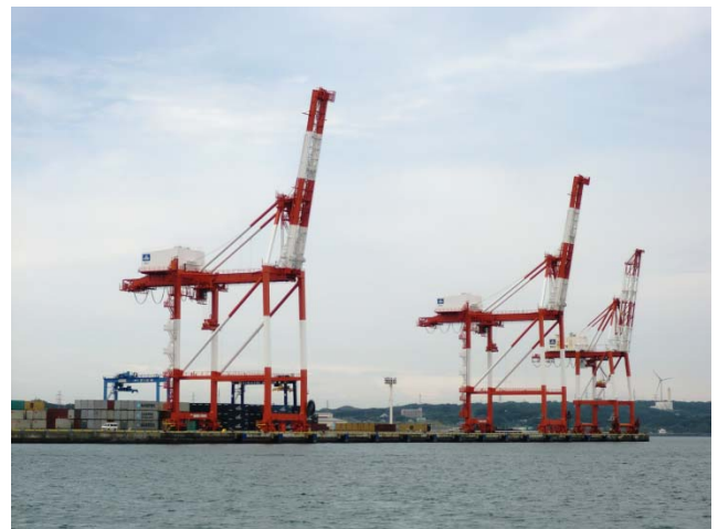
船上から見えるコンテナターミナル