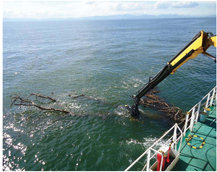
多関節クレーンによる引き揚げ作業