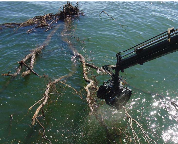
チェーンソーによる裁断作業