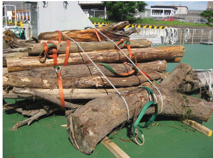
9月5日に回収した流木(約18m 3 )