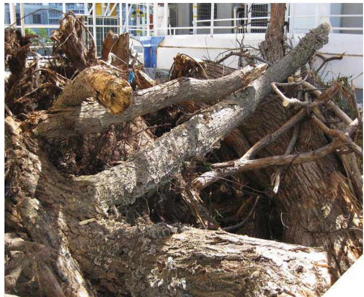
9月6日に回収した流木(約25m 3 )