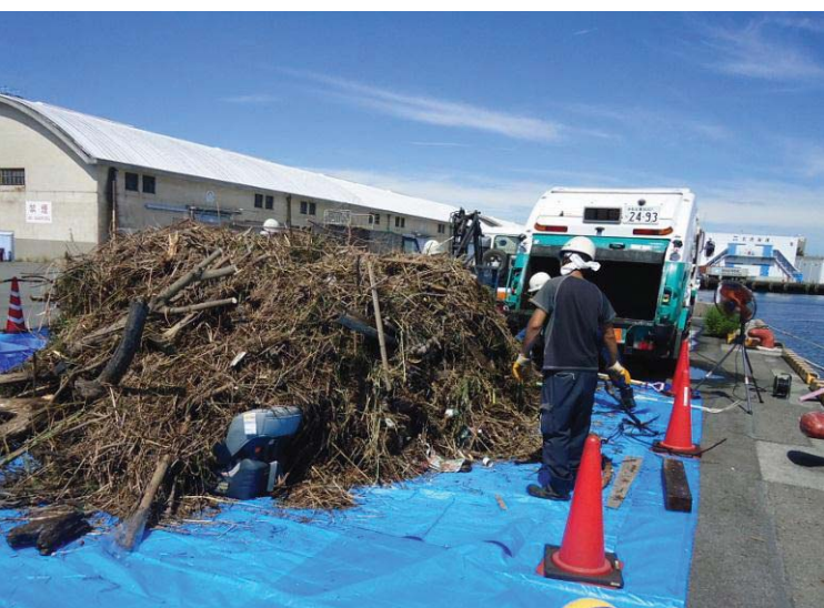
9月5日回収分(草木約25m 3 )の陸揚げ作業