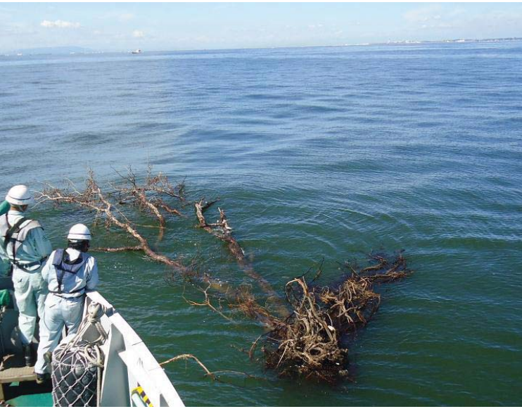
漂流していた巨大な流木(9月6日)