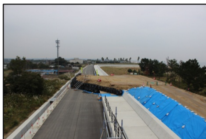
＜ 北側：施工完了区域 ＞