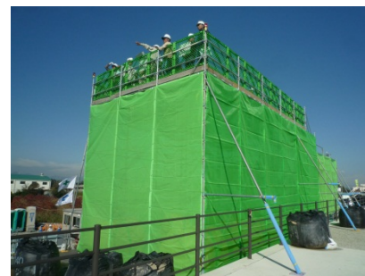
＜ 櫓 ＞