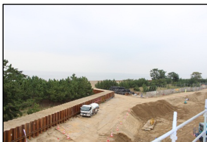
＜ 海側 ＞