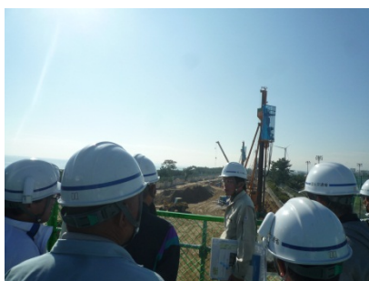
＜ 地盤改良工事 ＞