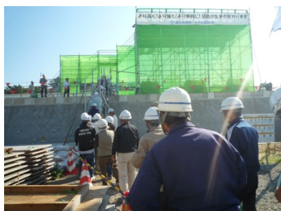
＜ 櫓へ移動 ＞