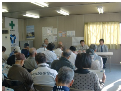
＜ 座学 ＞