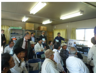
＜ 模型を使用した液状化実験 ＞