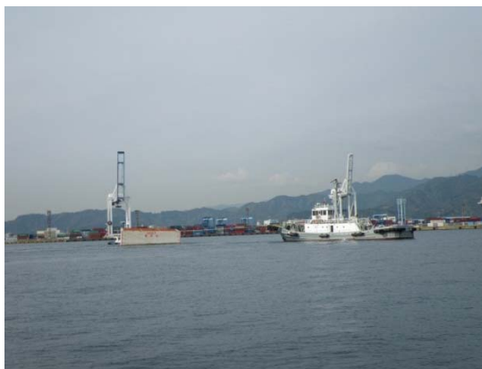
④ケーソンを据付場所まで曳航します