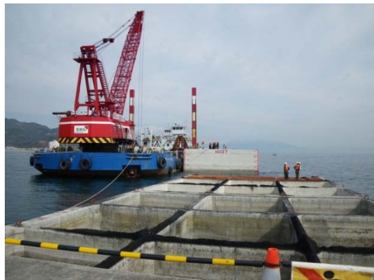
⑤ケーソンの据付位置を調整します