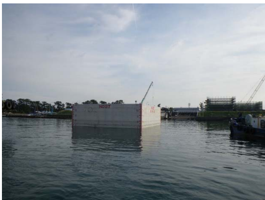
③ケーソンを海上に浮かせます