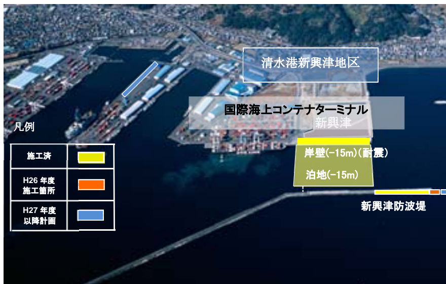
新興津国際海上コンテナターミナル整備事業