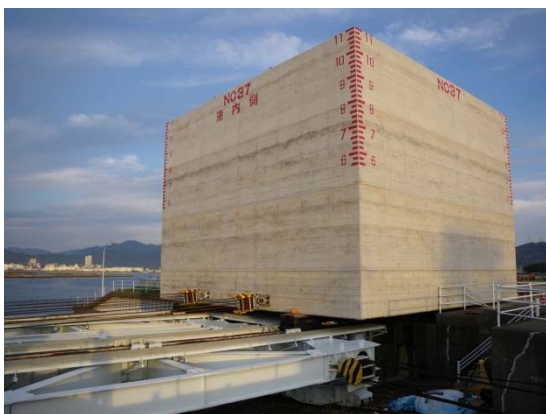
①ケーソンを横引きして台車に載せます