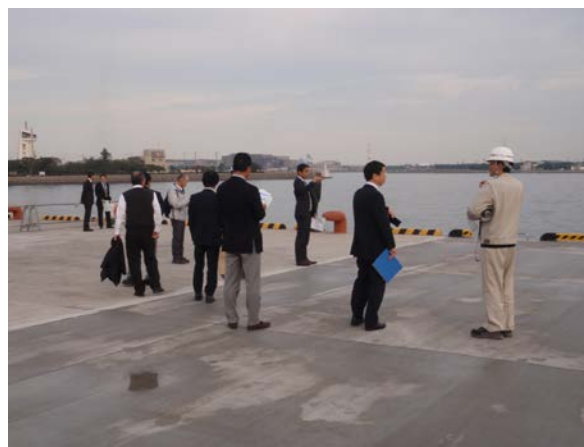
参加者から熱心な質問をいただく