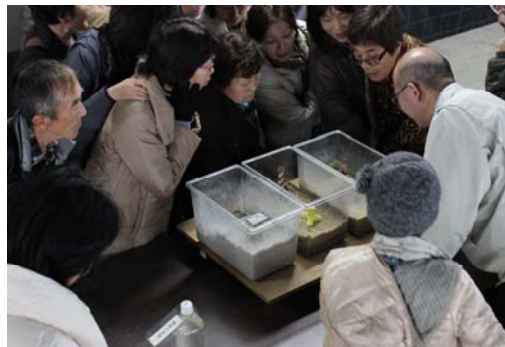
地盤液状化実験の様子