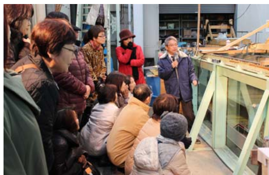
長水路水槽での津波防波堤越波実験の様子