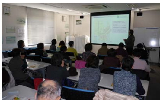
大治町周辺の地震の影響についての説明

3. 問い合わせ先 国土交通省 中部地方整備局 名古屋港湾空港技術調査事務所(伊勢湾水理環境実験センター) 総務課 近藤(こんどう)、水元(みずもと) TEL 052-612-9981 FAX 052-612-9452