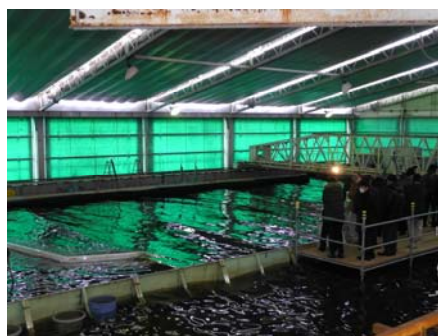
平面水槽での防波堤効果実験の様子