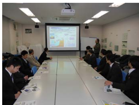
伊勢湾の環境についての説明

3. 問い合わせ先 国土交通省 中部地方整備局 名古屋港湾空港技術調査事務所(伊勢湾水理環境実験センター) 総務課 近藤(こんどう)、水元(みずもと) TEL 052-612-9981 FAX 052-612-9452