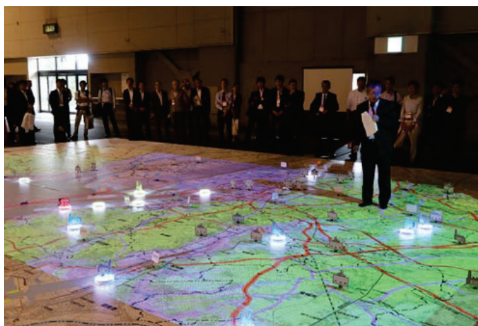
(ワークショップ 実施状況イメージ)