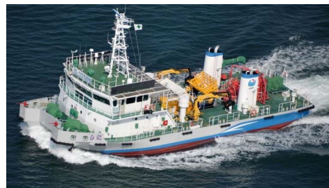
名古屋港湾事務所所属 海洋環境整備船「白龍」