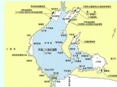
担務海域 伊勢湾・三河湾 (1,800km 2 )