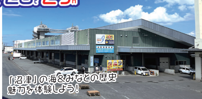
「沼津」の海&みなとの歴史 魅力を体験しよう!