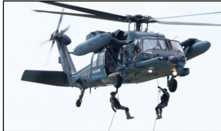
孤立者の捜索・救助・救護訓練