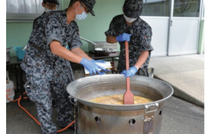
炊事車による炊き出し訓練