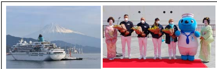
写真1:ドイツ客船「アマデア」入港時の様子